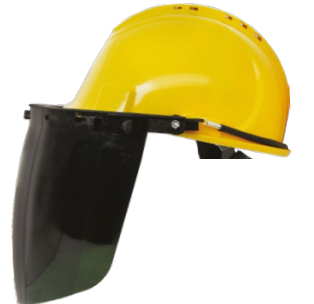
YS-53 + YS-55-G