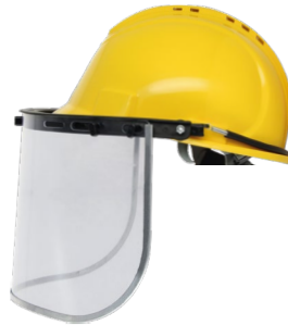
YS-53 + YS-54-C