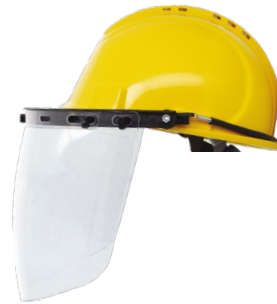
YS-53 + YS-55-C